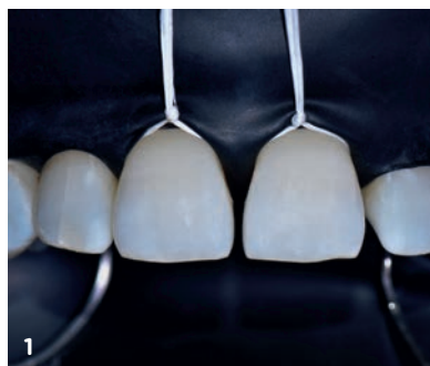
Fig. 1 - Isolamento degli elementi dentari con diga di gomma